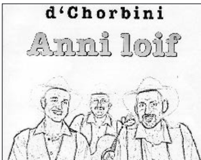
«Chorbini» treten mit ihrer CD-Taufe mit alten Walliser Liedern an die Öffentlichkeit.