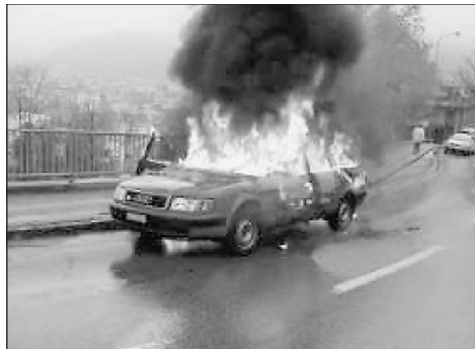
Ein Furcht erregender Anblick: Das Fahrzeug brannte von innen her vollständig aus.