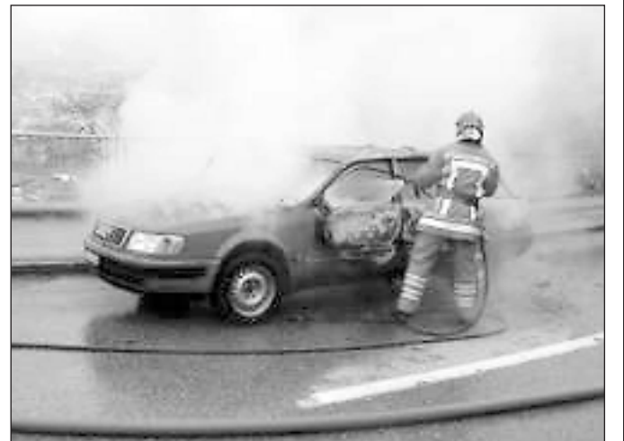
Der Visper Feuerwehr bereitete das Löschen des Fahrzeugbrands keine Probleme.